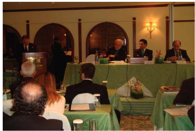
Arab-Greek Economic Forum, Greece January 2007

حفل إصدار كتاب "بوابة قطر للأعمال" في مقر الرابطة يناير ٢٠٠٧