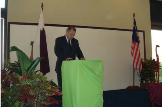
Asian Showcase 4th January 2007