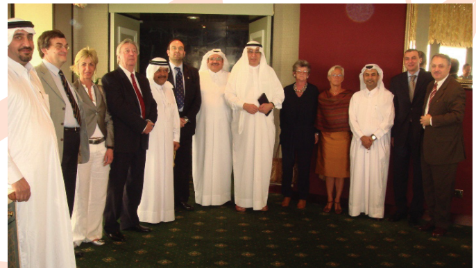
Special Luncheon For Italian Business Delegation 3rd April 2007

الملتقى الاقتصادي القطري الكوري الثاني مارس ٢٠٠٧