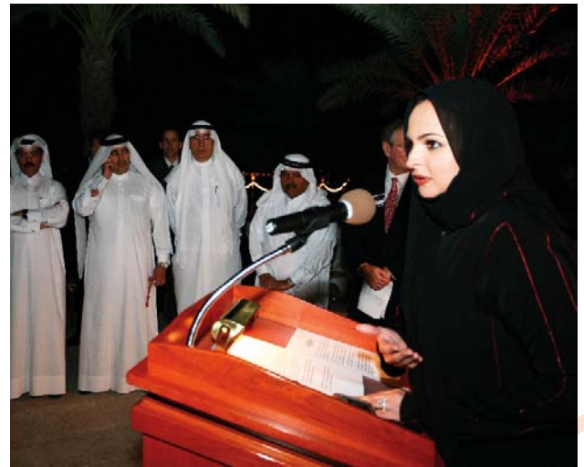
2nd Networking Event For Financial Professionals 28th February 2007

الملتقى الثاني لخبراء المال والأعمال فبراير ٢٠٠٧