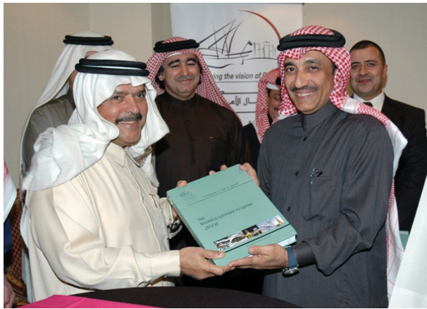
Launching Ceremony for the "Business Gateway to Qatar," QBA Premises January 2007

زيارة الوفد الألماني لمقر الرابطة يناير ٢٠٠٧