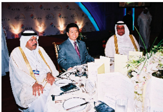
Second Qatar Korea Business Forum 28th March 2007

توقيع مذكرة تفاهم بين الرابطة وغرفة تجارة وصناعة ألمانيا فبراير ٢٠٠٧