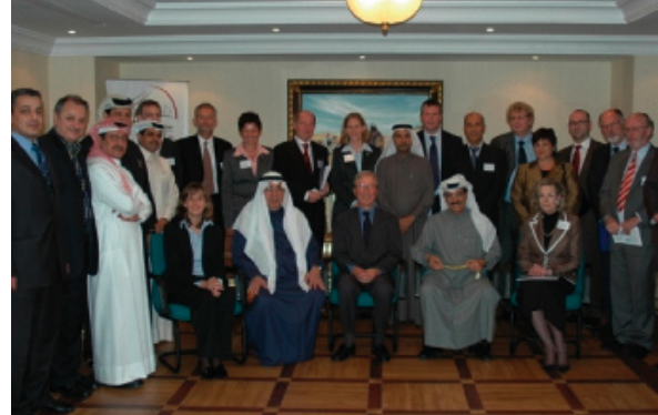
Visit of a German Delegation To QBA Premises January 2007

زيارة الوفد الألماني لمقر الرابطة يناير ٢٠٠٧