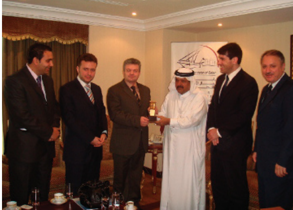
Macedonian Deputy Prime Minister and Delegation Visit to QBA 20th February 2007

زيارة نائب رئيس وزراء مقدونيا و الوفد المرافق له لمقر الرابطة فبراير ٢٠٠٧