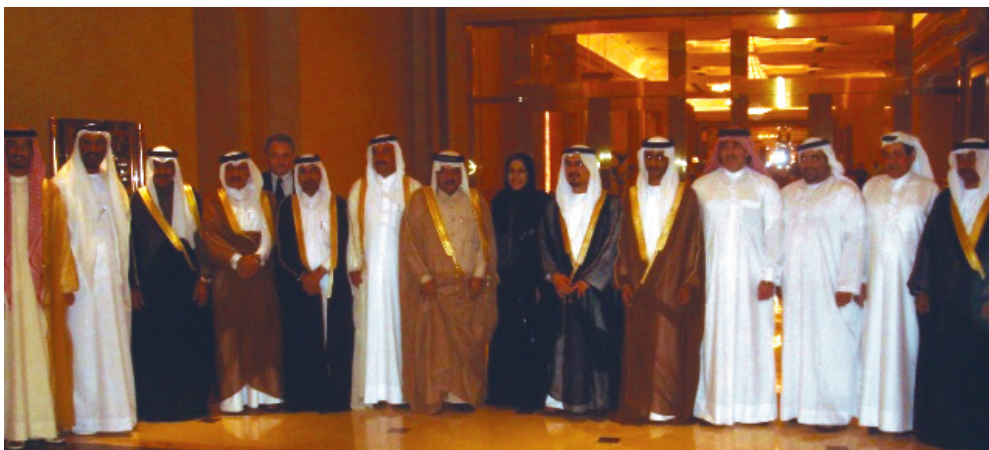
MOU Signing Ceremony Between QBA and Abu Dhabi's Chamber of Commerce and Industry, UAE 5th February 2007

المنتدى الاقتصادي العربي اليوناني - اليونان يناير ٢٠٠٧