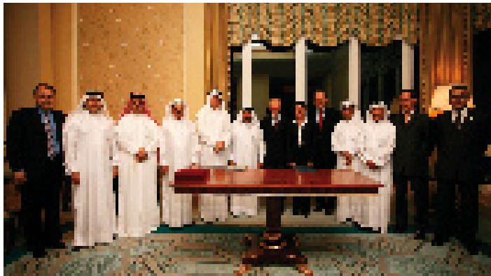
MOU Signing Ceremony Between QBA and The German Industry & Commerce Office 5th February 2007

الملتقى الثاني لخبراء المال والأعمال فبراير ٢٠٠٧